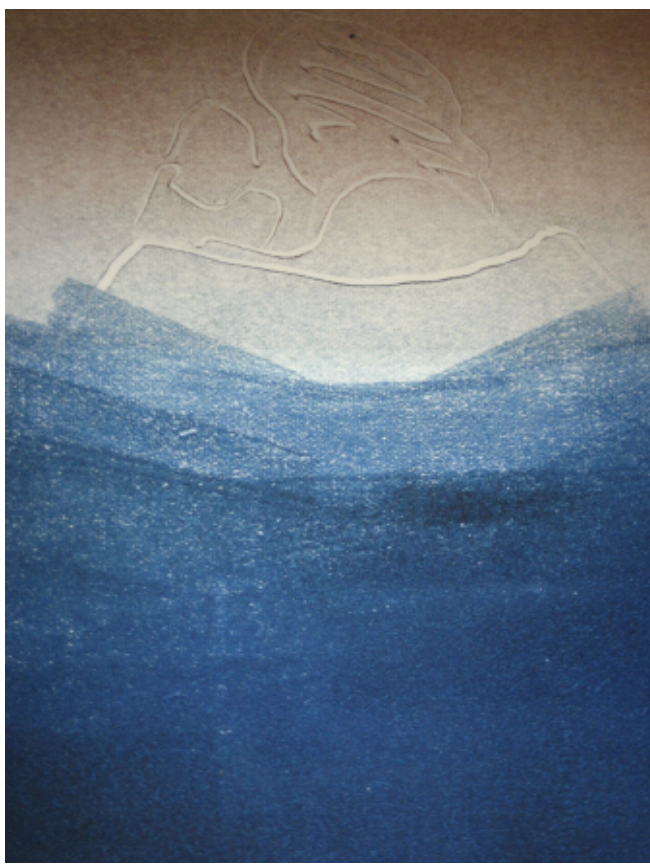
Zonder titel, 16 x 20 cm, 2007

Een rondleiding is vrijdag 20 februari om 16.00 uur , verzamelen Van Boetzelaerstraat 92.